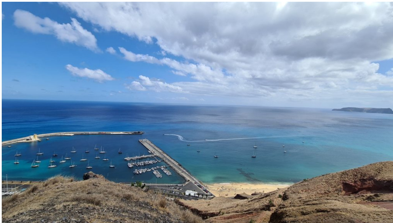
Aussichtspunkt über der Marina

Wir haben sehr schöne Spaziergänge gemacht, sind mit dem Fahrrad zur Westspitze und zum Einkaufen gefahren und hatten eine schöne Zeit.