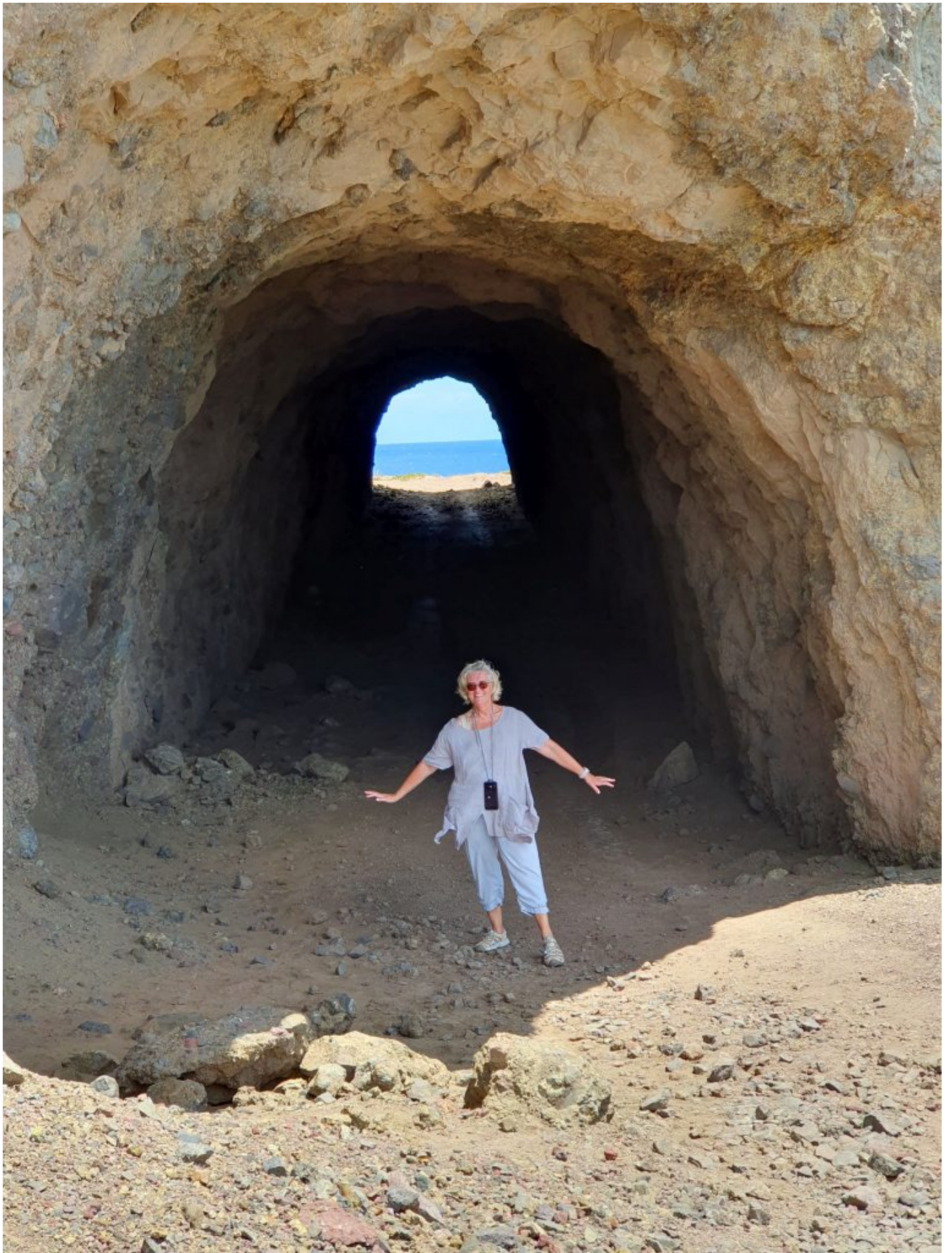
Tunnel zur Nordseite der Insel - Ganz im Osten