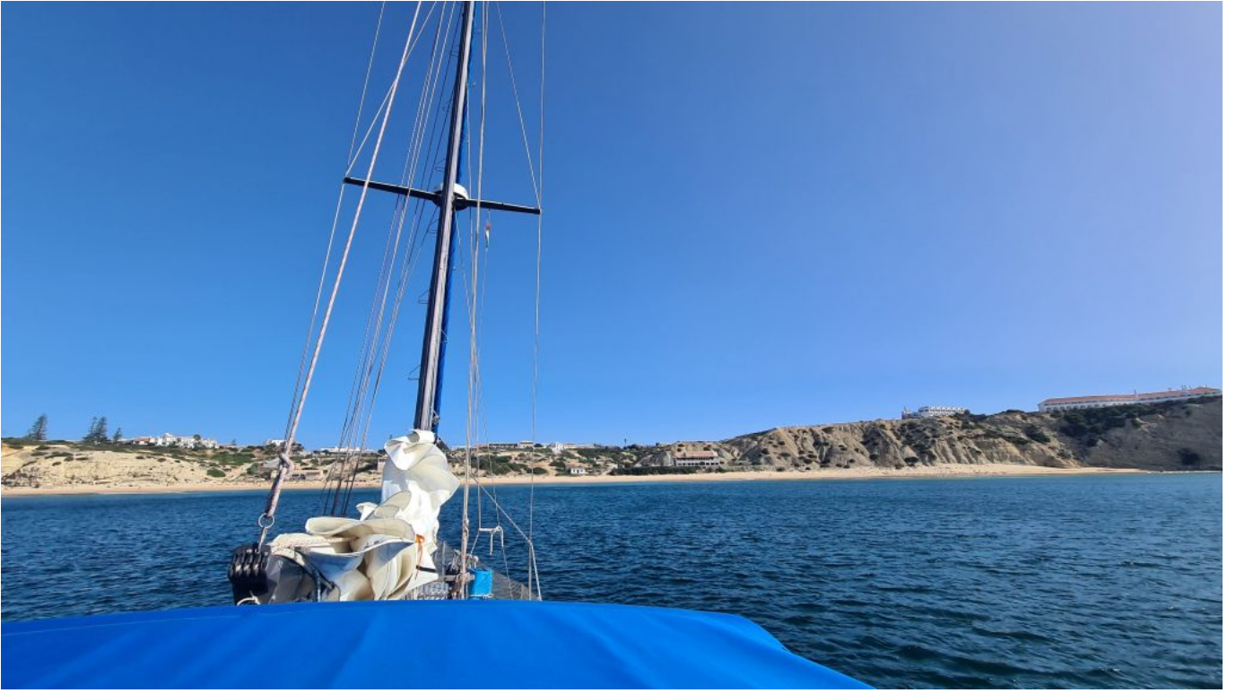
Enseada de Sagres.