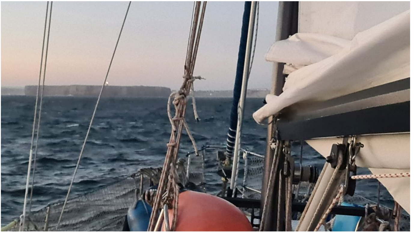
In der Abenddämmerung in Anfahrt.

Der Anker fiel in Sand, wir machten letzte Arbeiten, aßen was und fielen ins Bett. Angekommen an der Algarve!