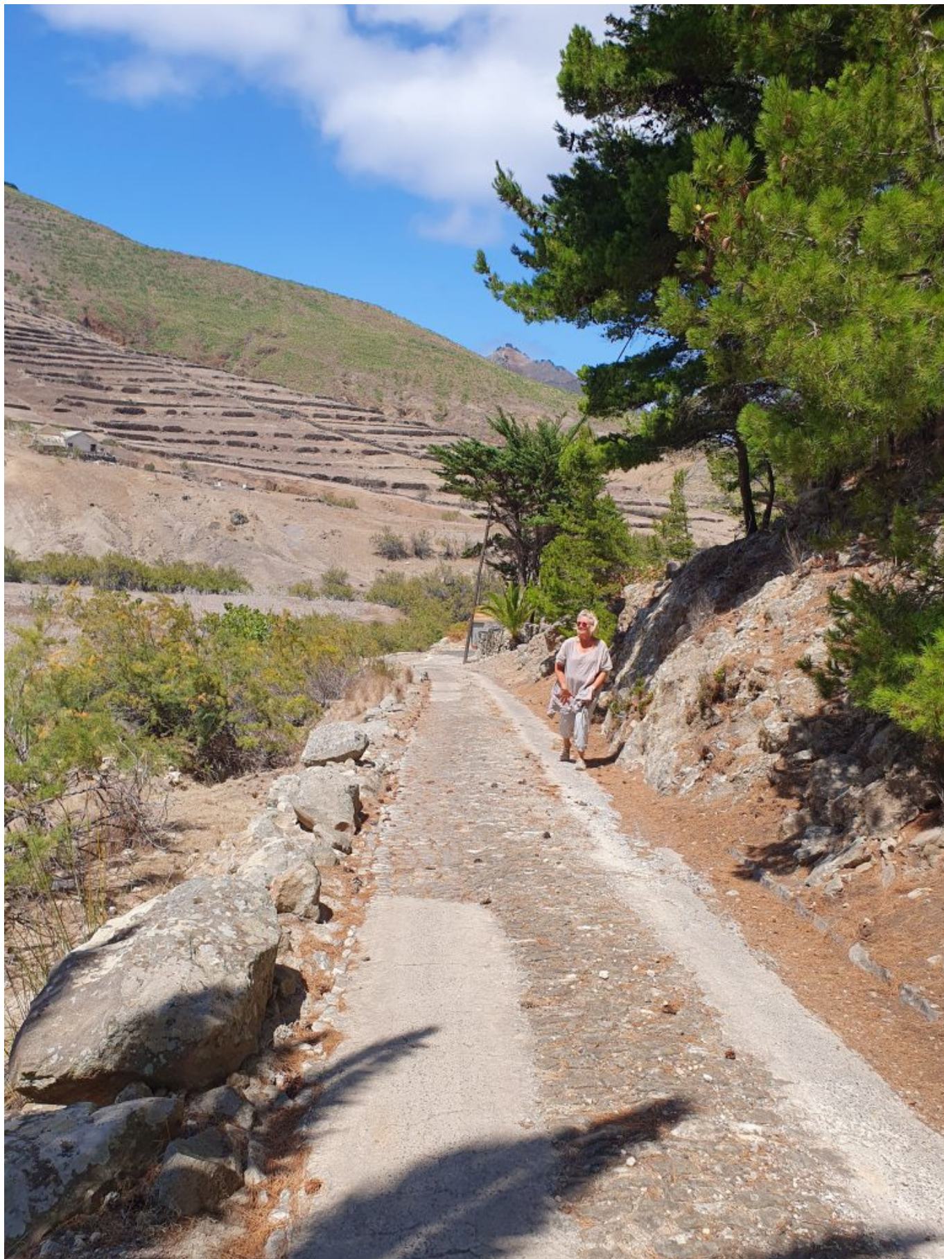
Wanderung auf der Ostseite