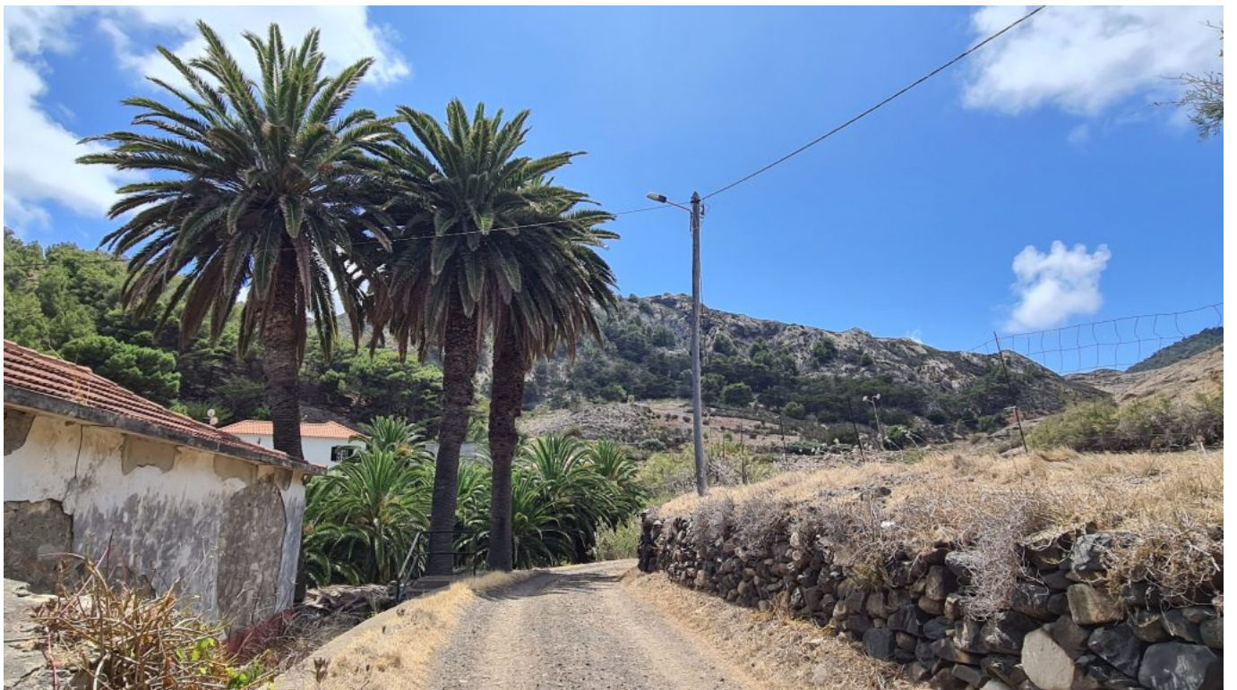
Ab hier gings Aufwärts