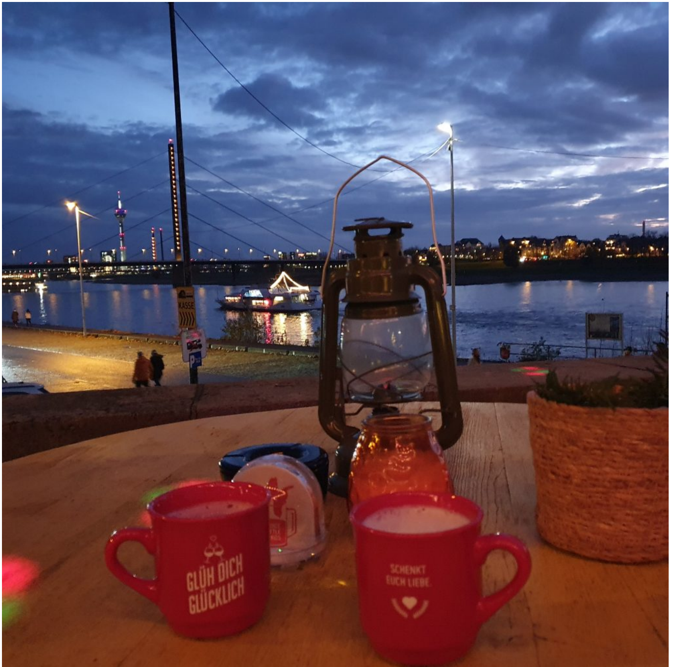
Glühwein am Rhein genießen