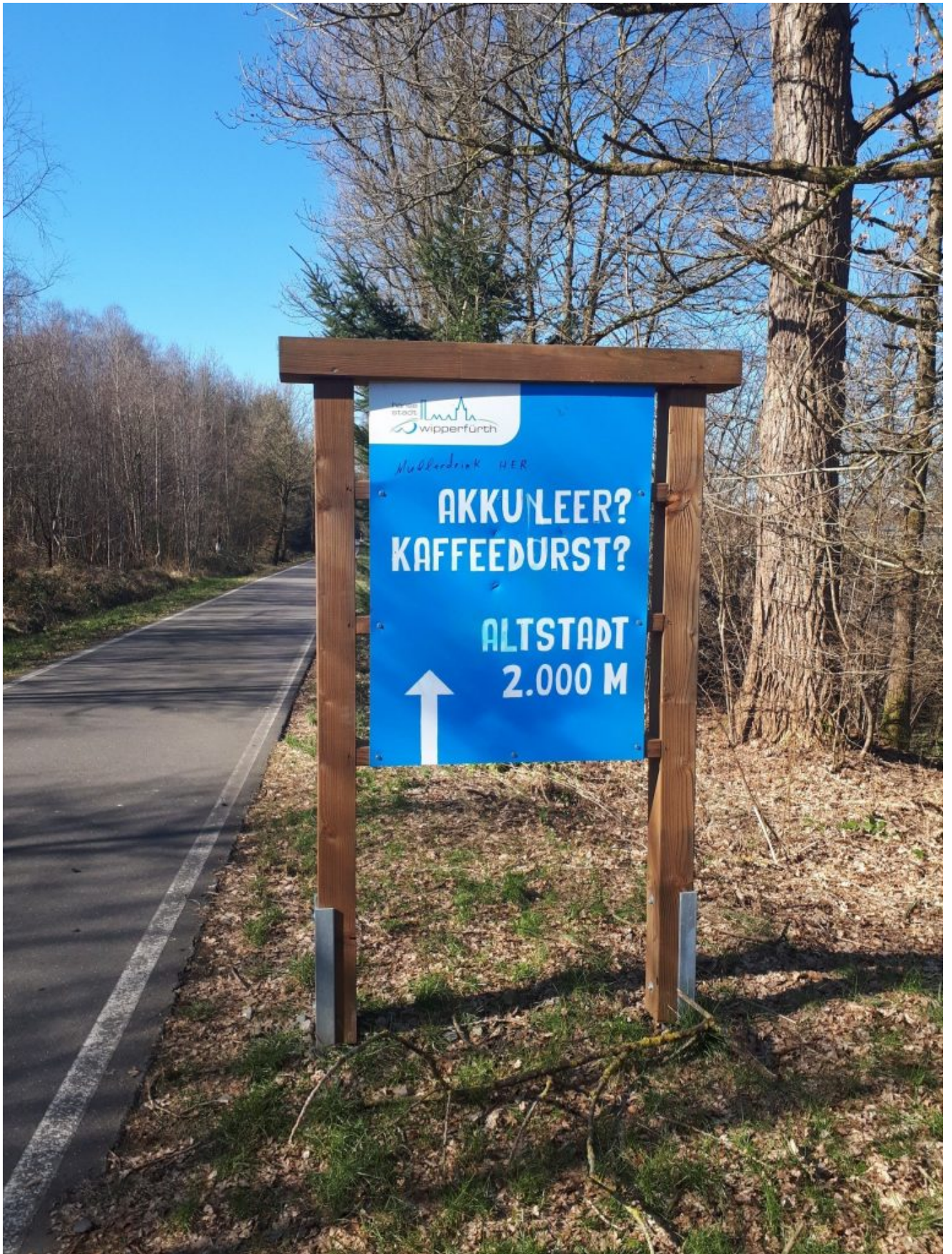
Ja alles...aber es ging noch 15km weiter bis zur Pause