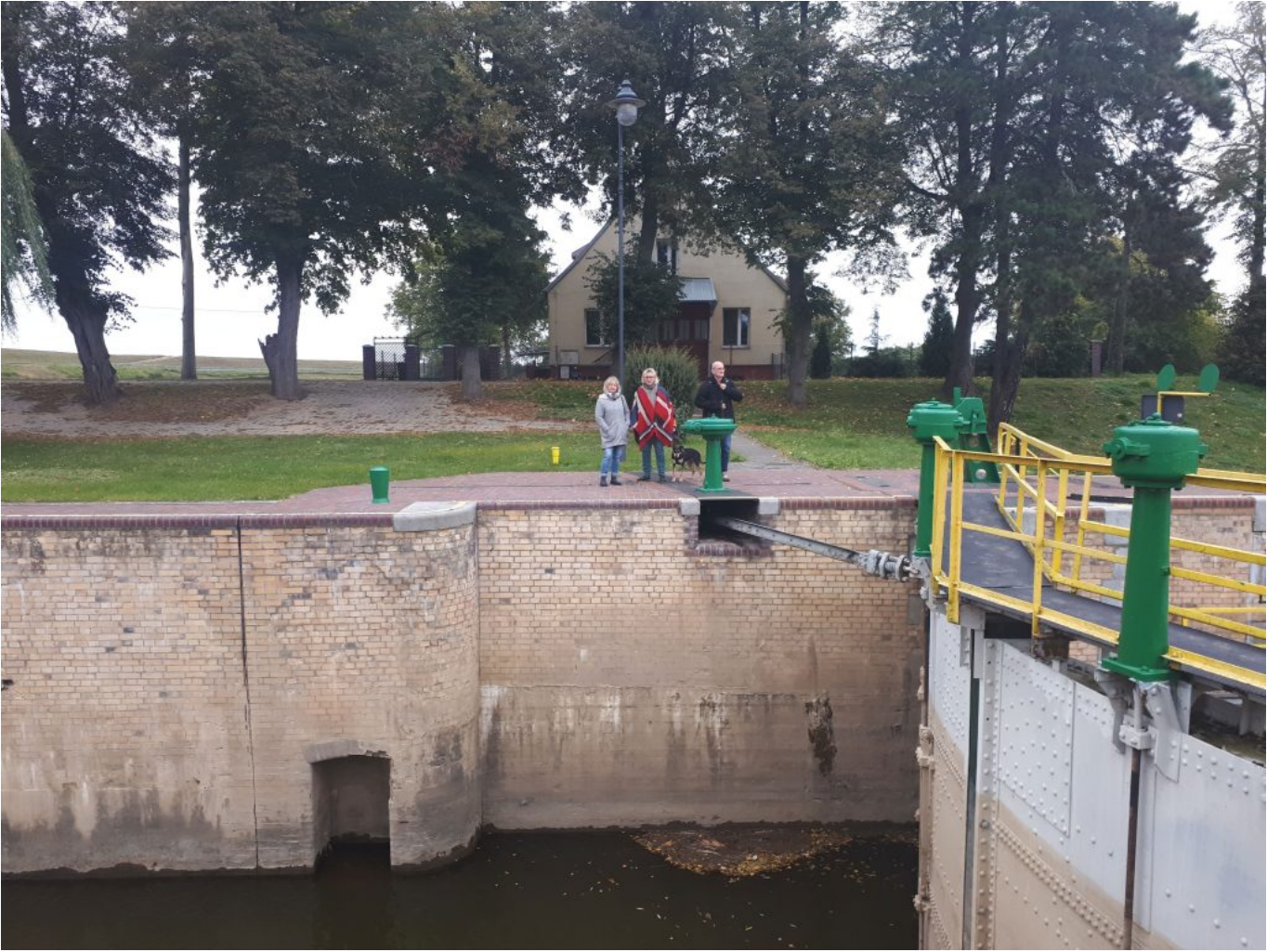
Schleuse in Polen