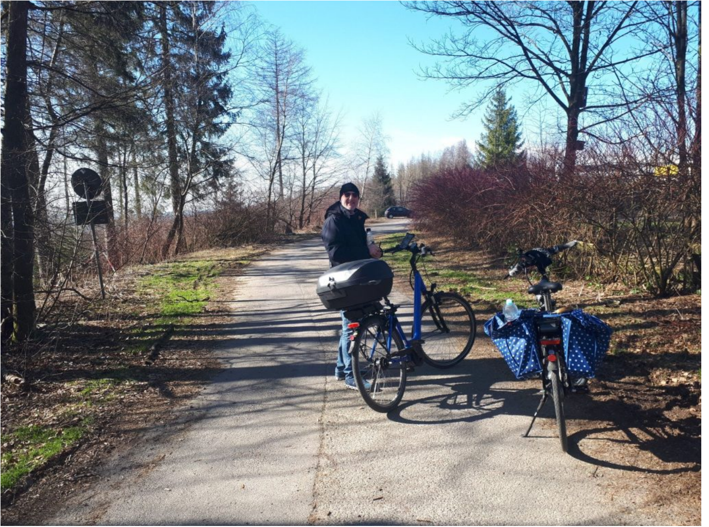
Radtour Wenden - Düsseldorf - 107 km - Puh