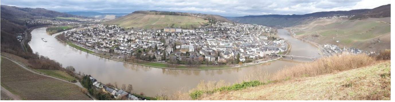
Bernkastel Kues Moselschleife