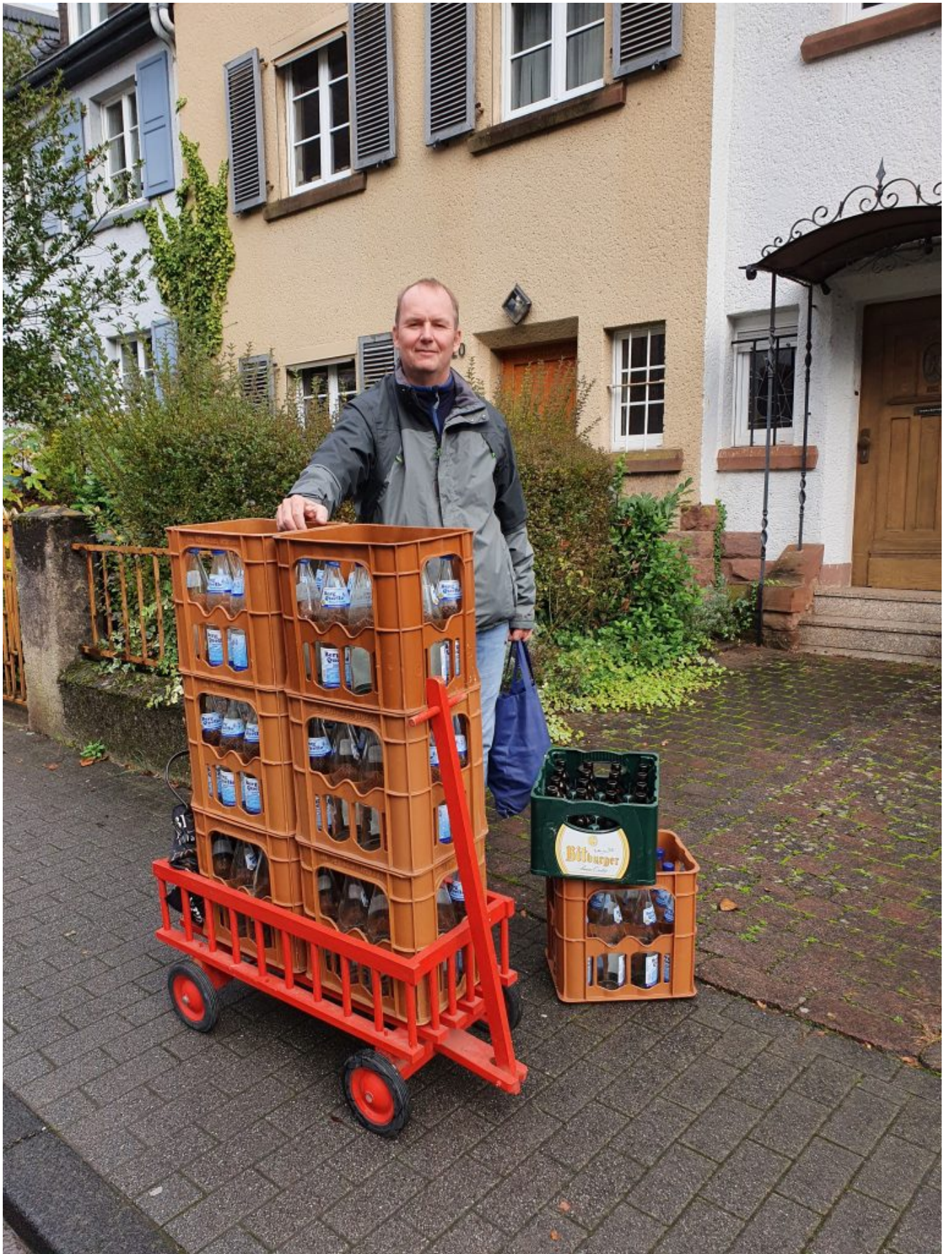
Kästenentsorgung in Trier