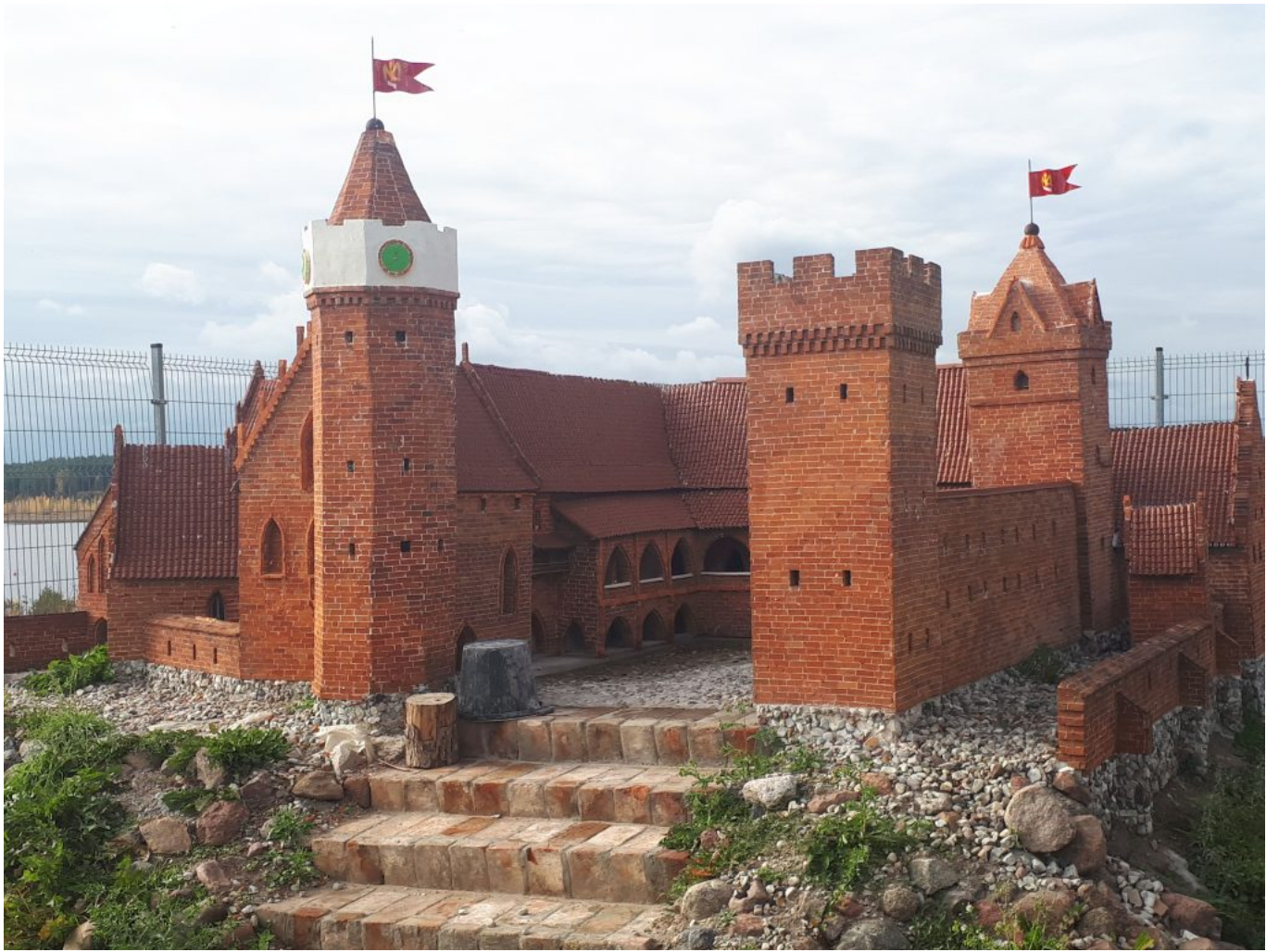
Model der ehemaligen Burg in Prabuty