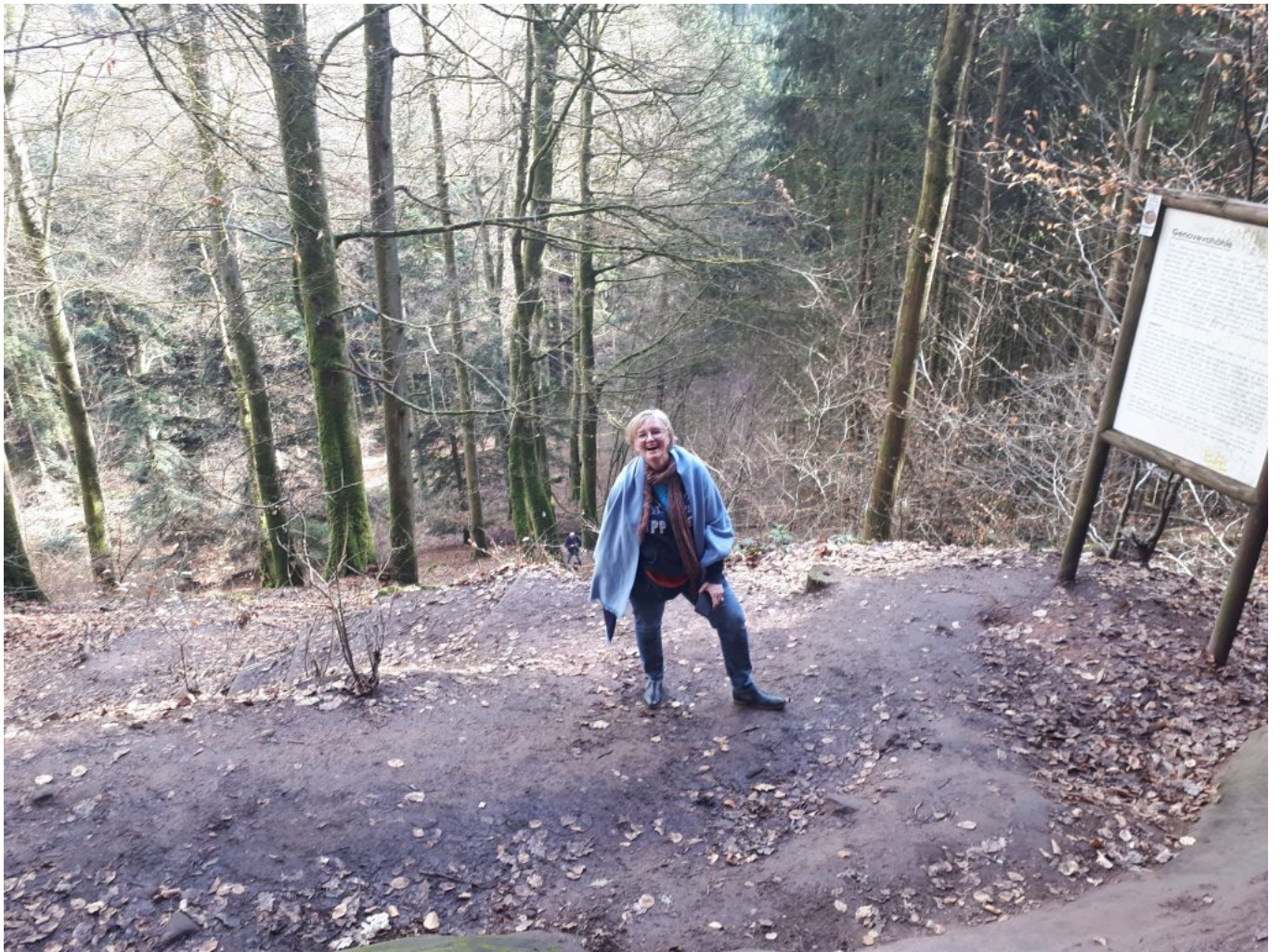
Wanderung zur Genoveva Höhle