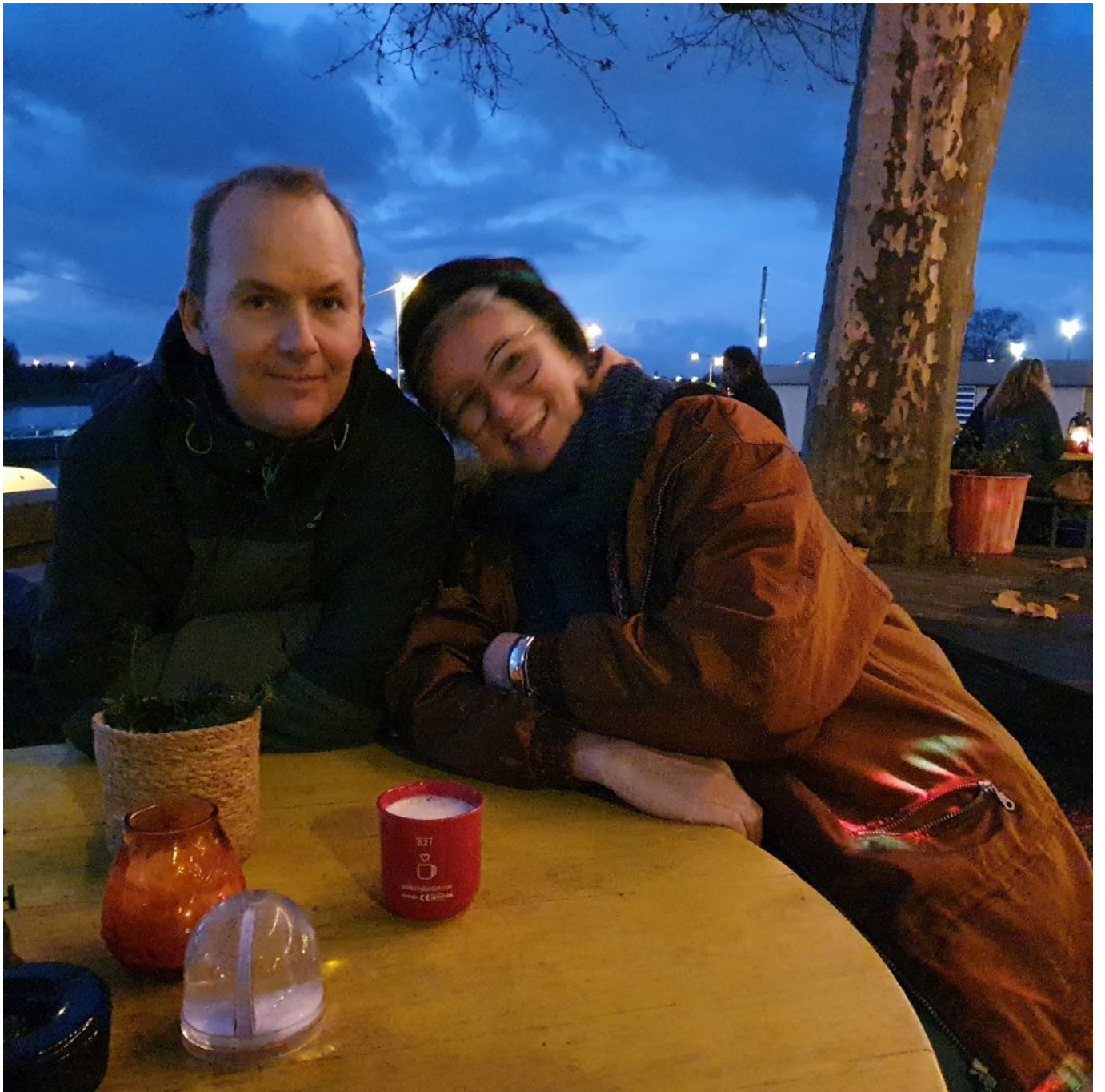
Glühwein am Rhein genießen